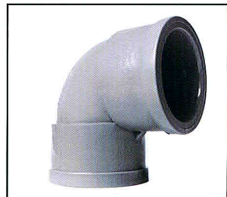
CODO 2" X 90°

*Cemento Solvente para Tubos y Conexiones de PVC.